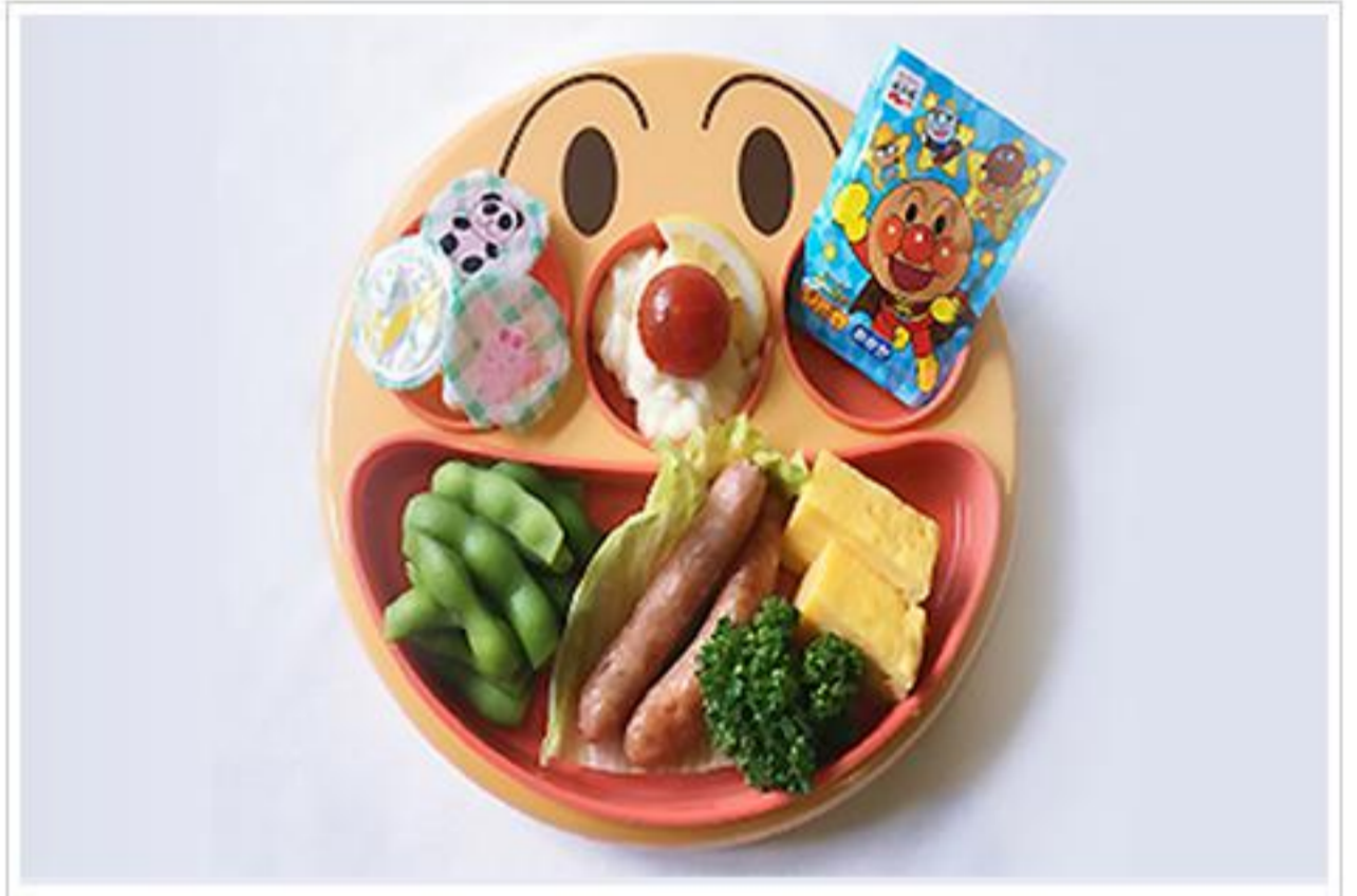
朝食キッズプレート