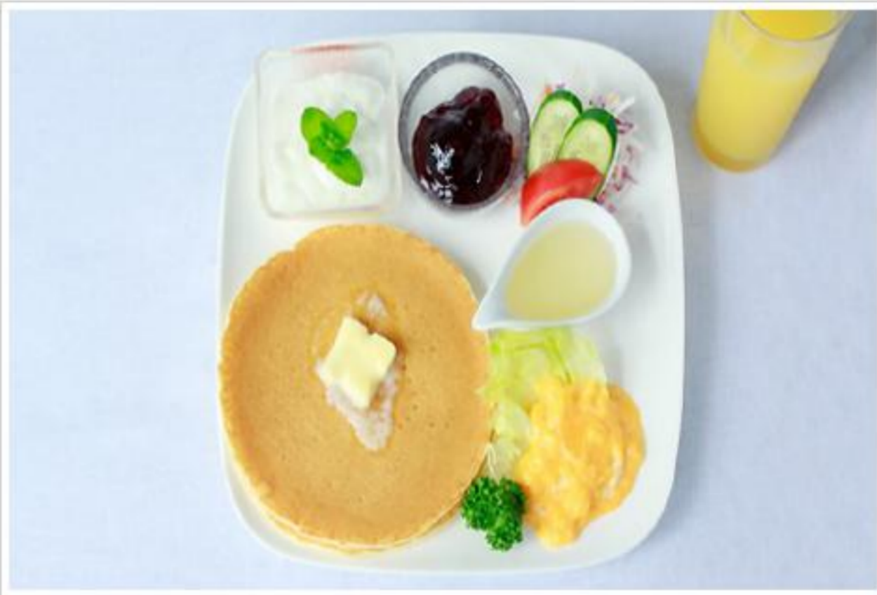
朝食パンケーキプレート

新鮮な野菜をたくさん使用した朝食セット。 竹田の名水と平飼いでストレスなく育った鶏から生まれた美味しい卵が食べ放題!