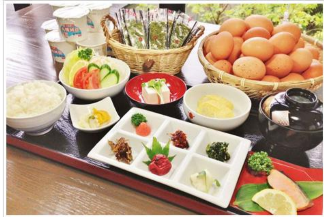
和朝食(くじゅうの地卵食べ放題)