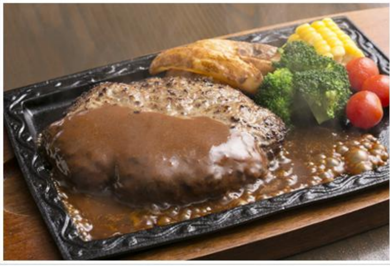
シェフ特製ハンバーグステーキ