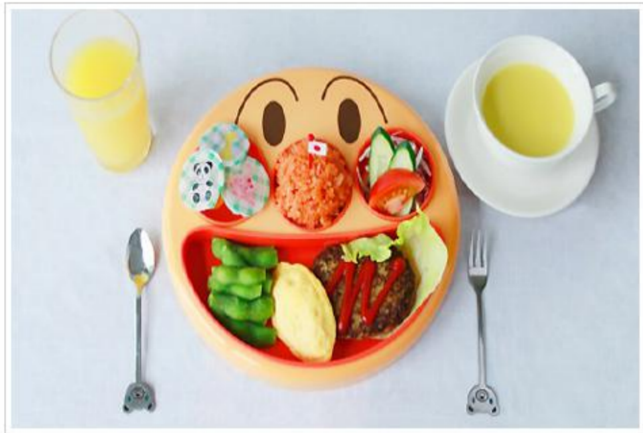
キッズハンバーグプレート